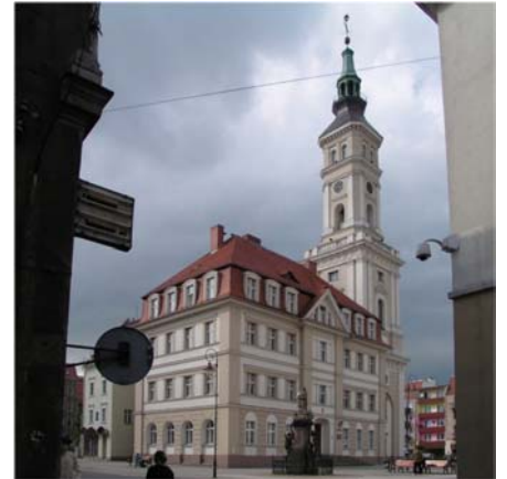
Neustadt/Prudnik, am Ring