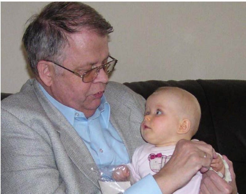
„Wer bist denn du?“