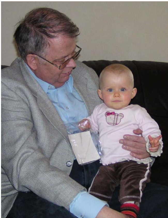
Die allmähliche Annäherung zwischen Justine und dem Opi aus Leverkusen